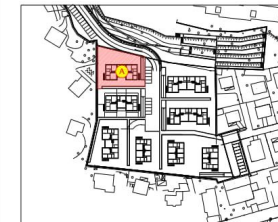
PLANIMETRIA GENERALE EDIFICIO