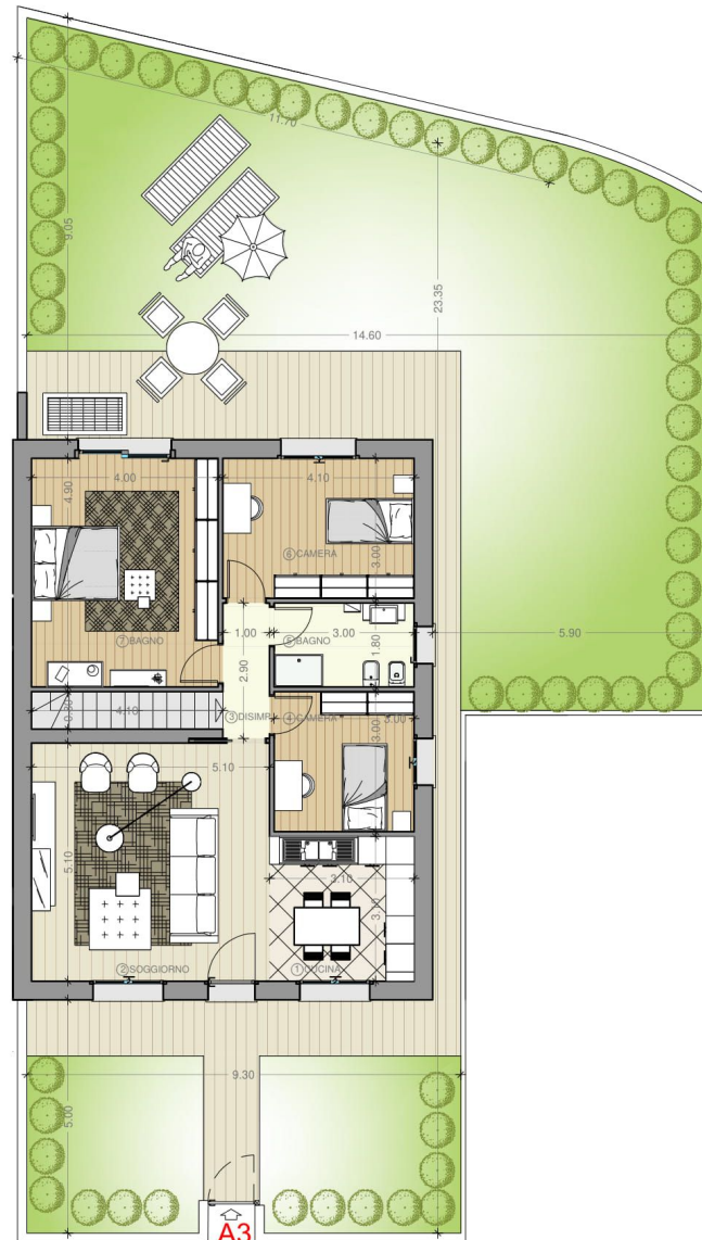
PLANIMETRIA PIANO TERRA

Comune di PONTE SAN PIETRO (BG) RESIDENZA IL ROCCOLO APPARTAMENTO A3 DATA: 08/10/2020 SCALA: 1:50 Cell.: 335-6787013 Frigeni Sara