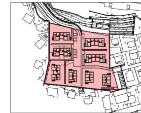
PLANIMETRIA GENERALE LOTTIZZAZIONE