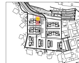
PLANIMETRIA GENERALE P. TERRA