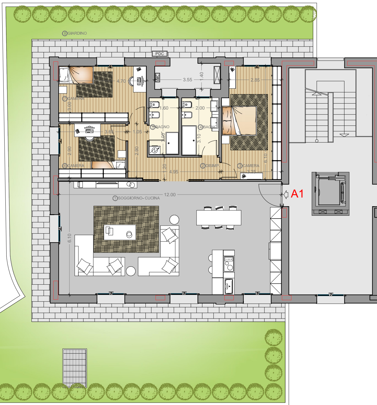
PLANIMETRIA PIANO TERRA