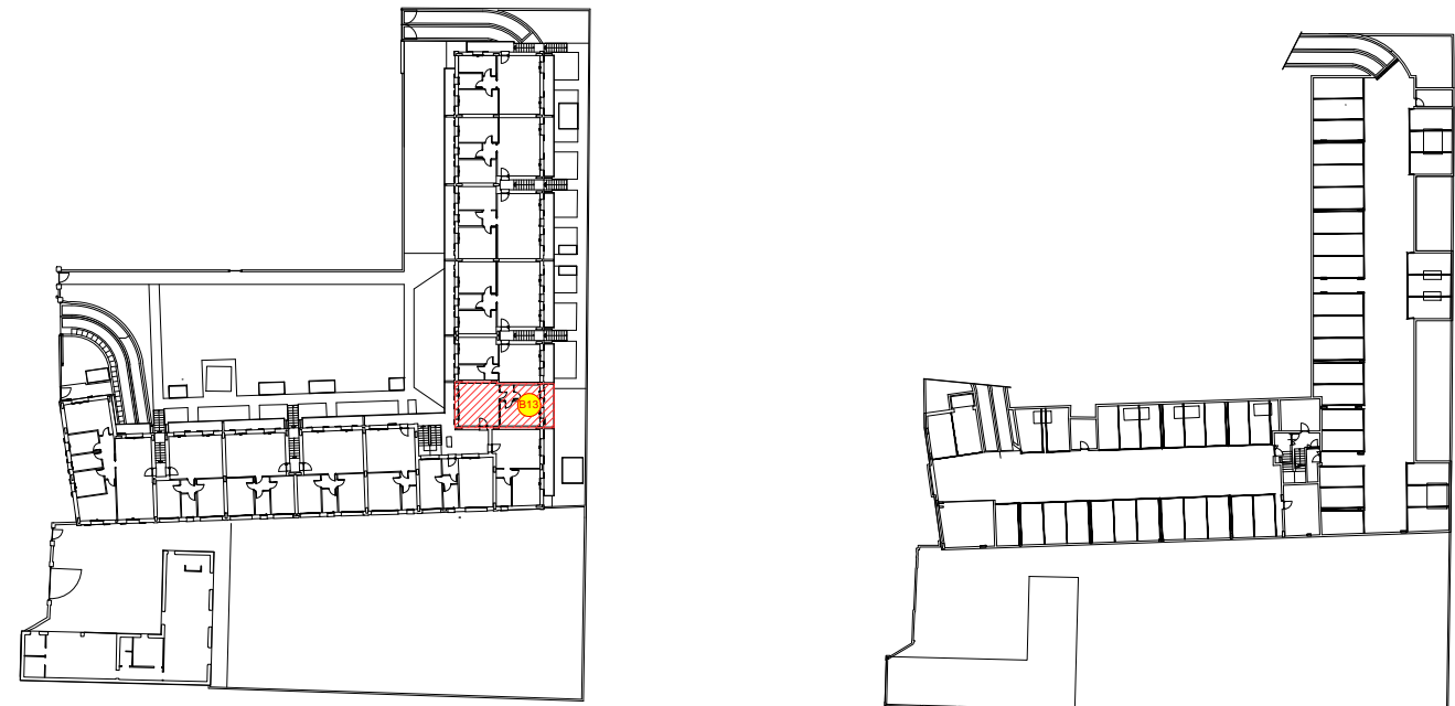
PLANIMETRIA GENERALE PIANO PRIMO