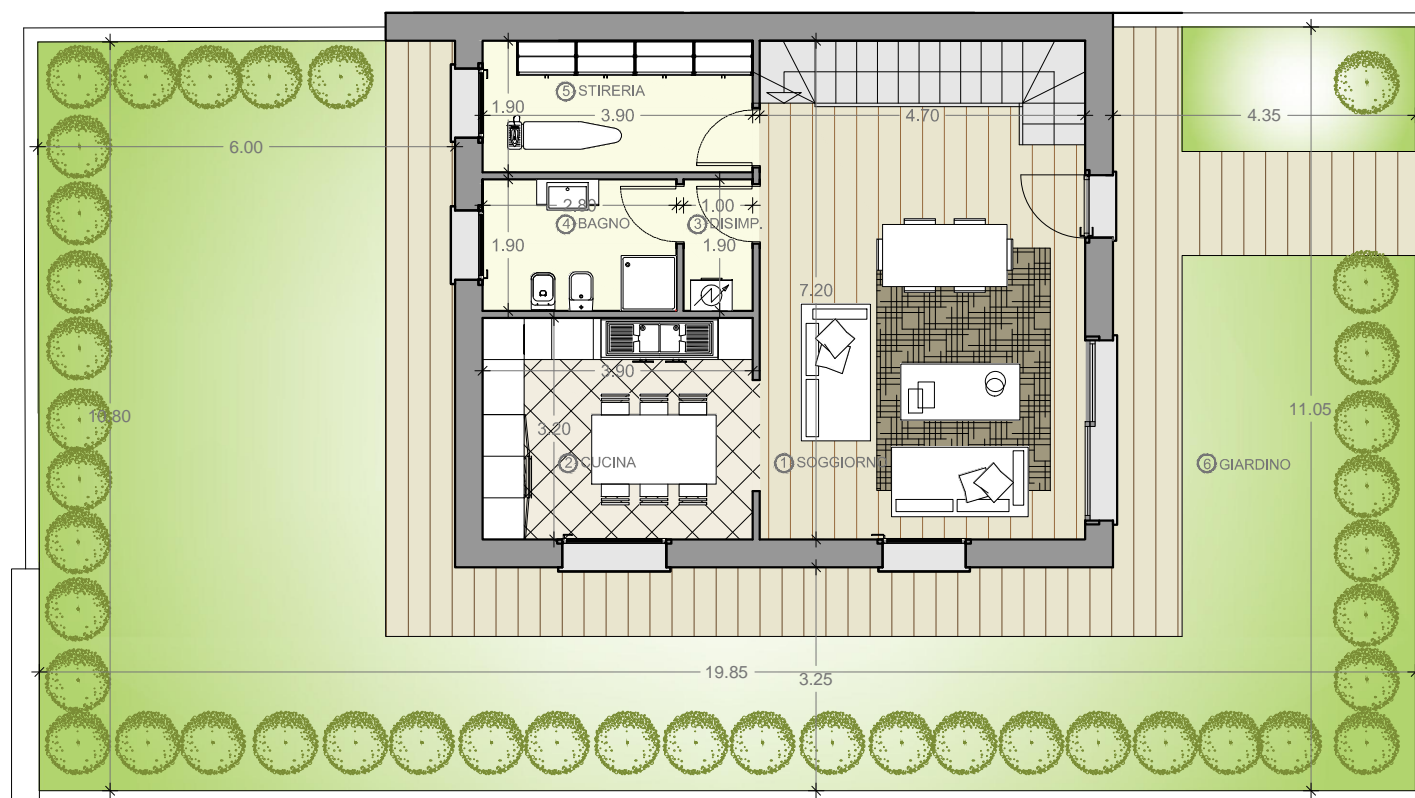
PLANIMETRIA PIANO TERRA