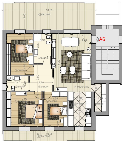
PLANIMETRIA PIANO PRIMO