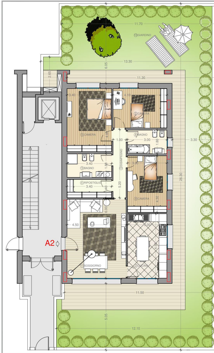
PLANIMETRIA PIANO TERRA