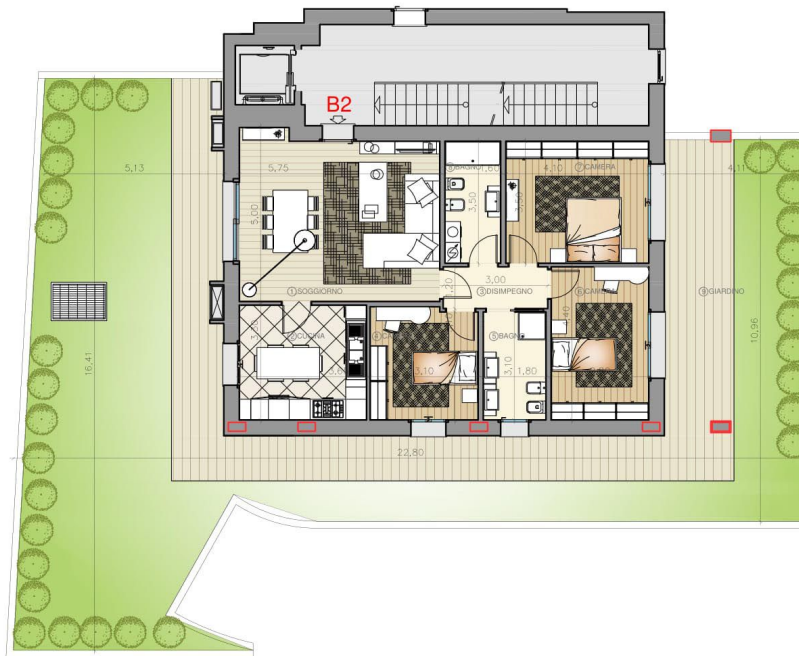
PLANIMETRIA PIANO TERRA