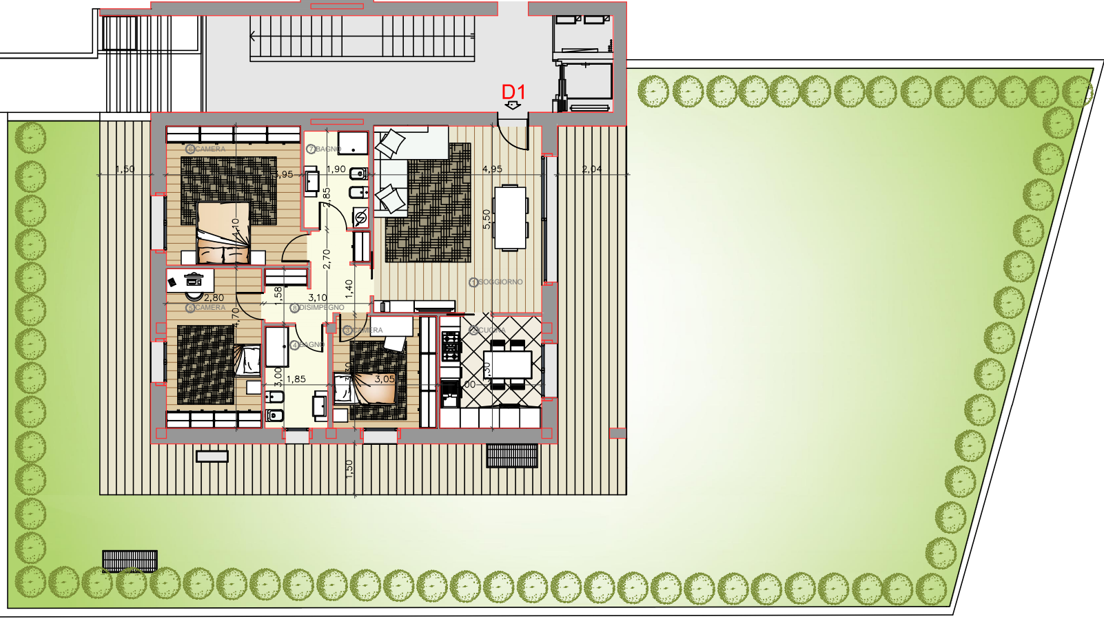
PLANIMETRIA PIANO TERRA