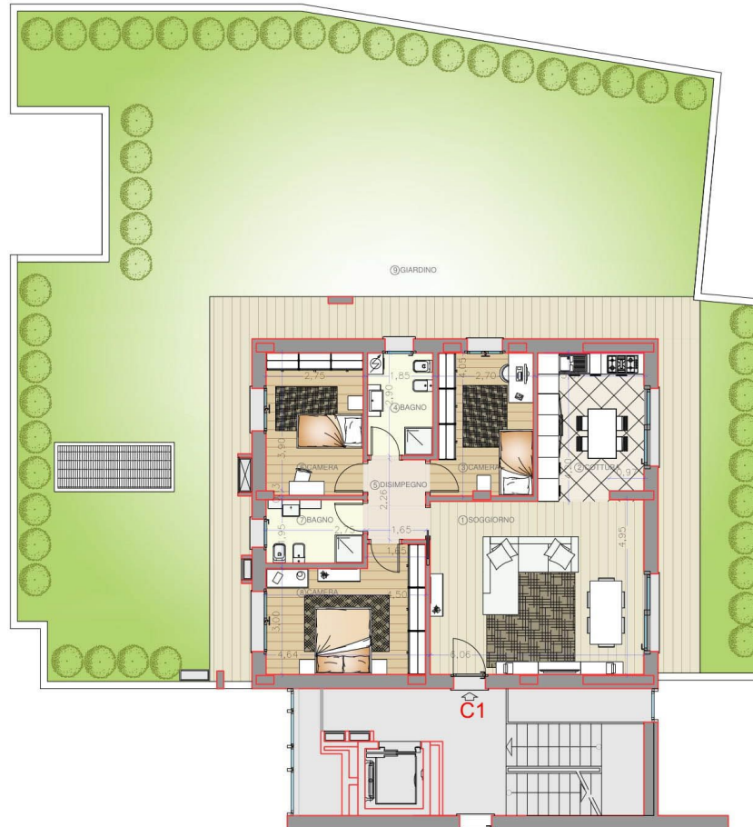
PLANIMETRIA PIANO TERRA